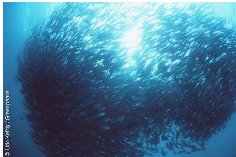
Ein Schwarm Fische im Mittelmeer.

Dazu gehört, dass im Kampf gegen den Klimawandel der Ausstoss an Treibhausgasen höchstens noch bis 2015 ansteigen darf und danach bis 2050 um mindestens die Hälfte reduziert wird.