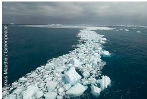
Eisschollen treiben auf dem Wasser vor dem Drygalski Fjord auf der Inselgruppe Südgeorgien im Atlantischen Ozean.

onsstörungen weit reichende Auswirkungen auf alles Leben an Land und im Wasser haben, auch wenn wir diese im Einzelnen nicht voraussehen können, da wir die betreffenden Prozesse noch zu wenig verstehen.