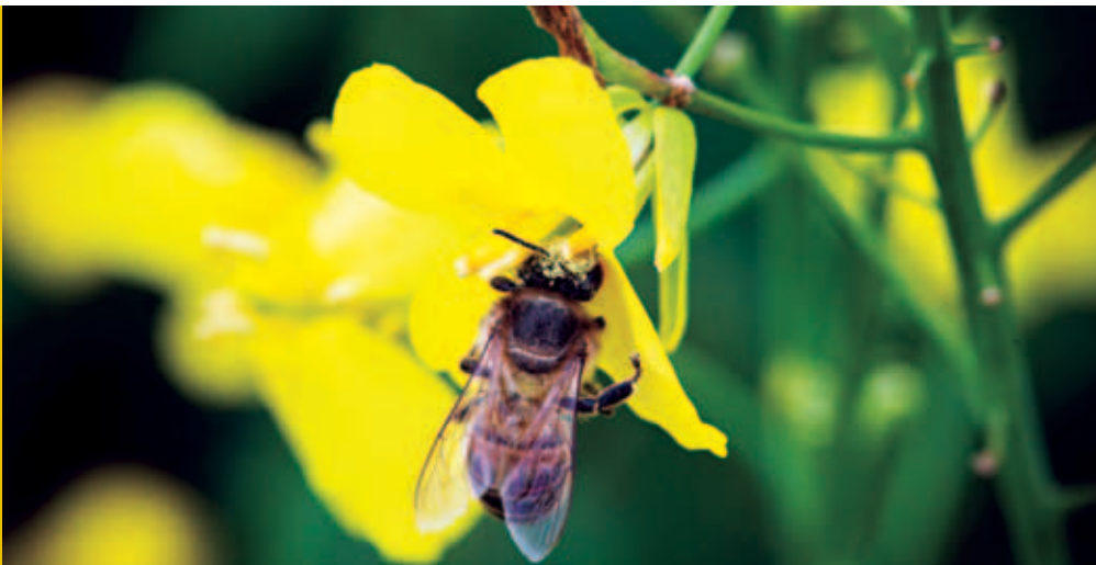
Abeille butinant des fleurs de colza, Allemagne.