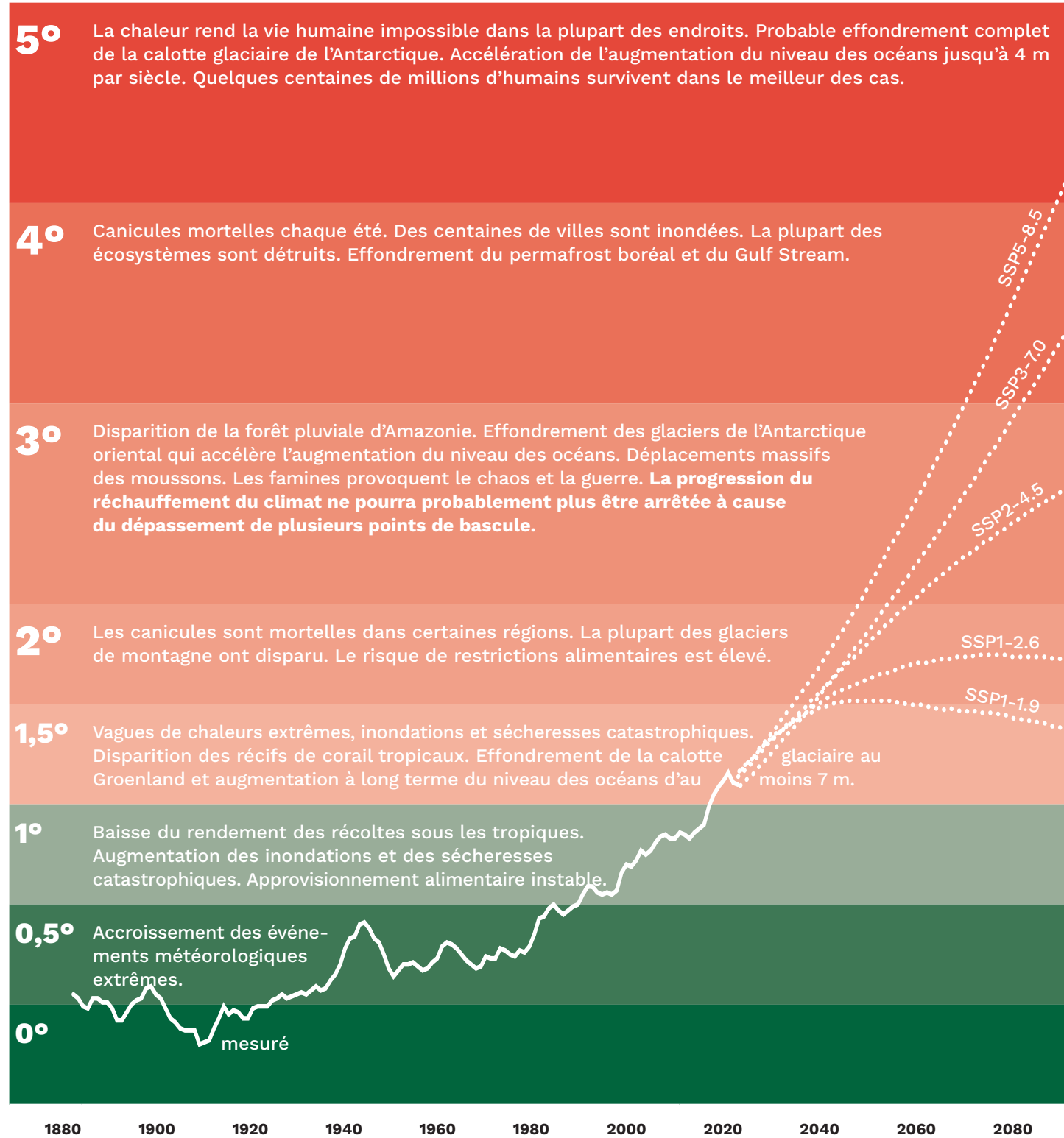
Graphique 2 : Historique des mesures de températures depuis 1885 18 adapté au scénario de base du GIEC (ère préindustrielle), ainsi que les 5 principaux scénarios climatiques pour l'avenir 19/20

de l'étranger dans plusieurs domaines comme l'alimentation, l'approvisionnement énergétique et le commerce. Une dégradation de la situation dans d'autres régions du monde a donc une influence négative directe sur la Suisse. 1