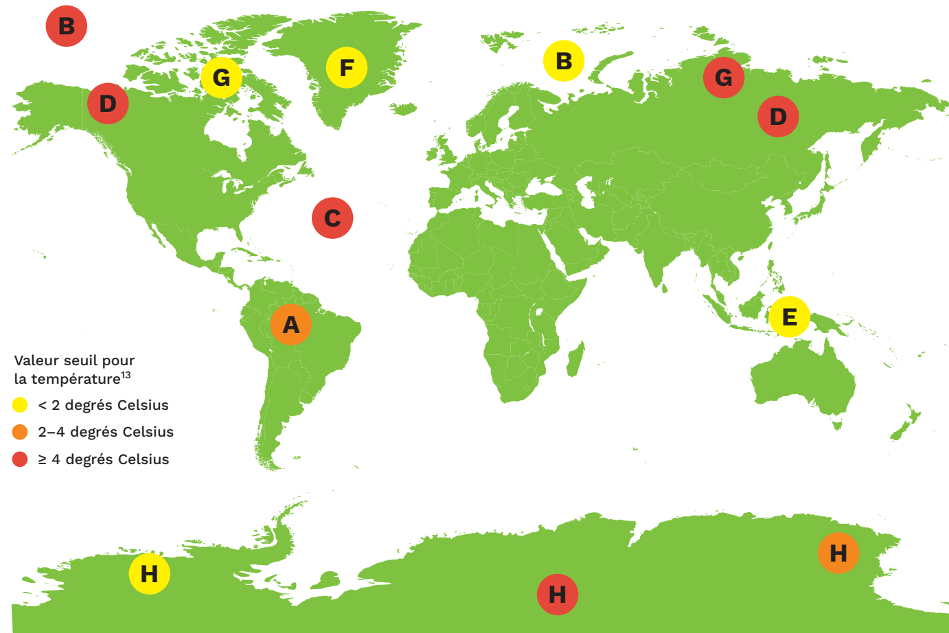
Graphique 1 : Carte de la planète avec les principaux points de bascule et évaluation des températures auxquelles la bascule a lieu 13

La mise en place de processus à grande échelle comme la transformation de l'Amazonie en savane (en cas de réchauffement de 2 à 3 degrés Celsius), les émissions de méthane des terres boréales qui dégèlent et la fonte des calottes polaires rendront incontrôlable le réchauffement du climat provoqué par les humains. 12