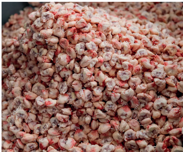
Têtes de poulet après décapitation

Greenpeace Suisse demande que le site AgriCo soit dédié à des projets réellement innovants et durables du secteur agroalimentaire – par exemple la permaculture ou l'agroforesterie – et qu'il s'oriente vers une activité économique qui préserve la région, l'environnement et le climat, dans l'optique d'un système alimentaire plus résilient.