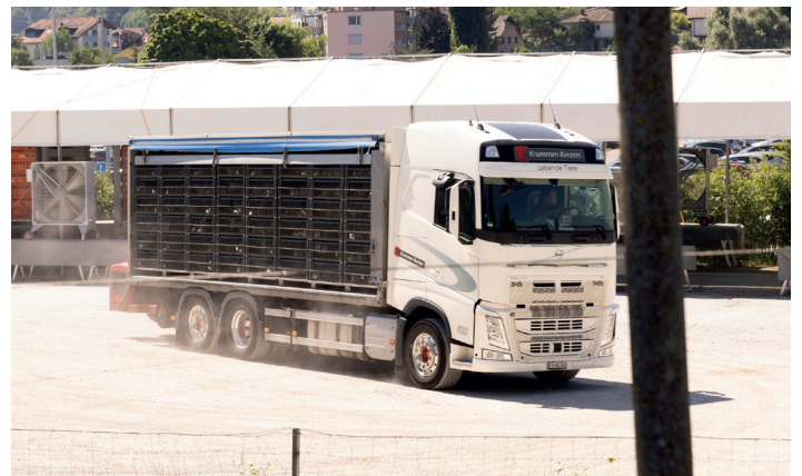
Arrivée de poulets transportés par camion à l'abattoir